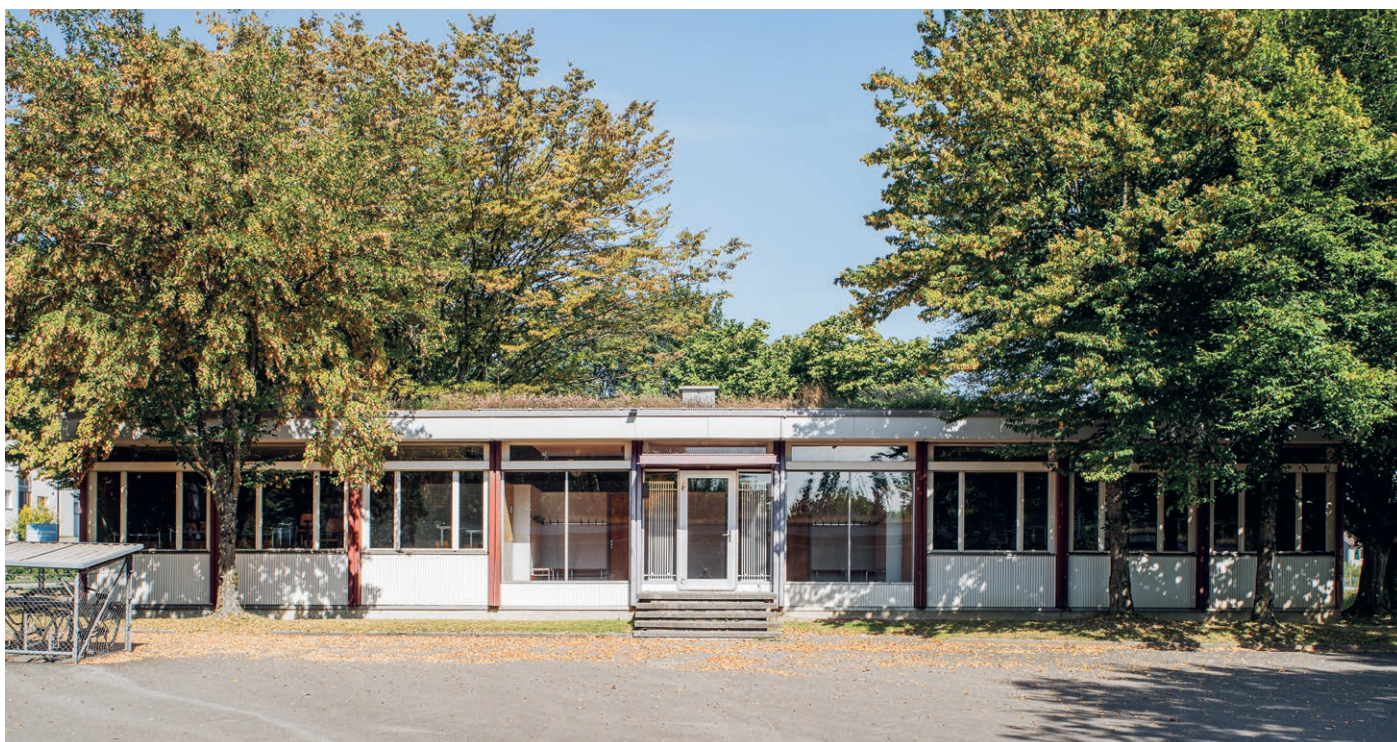
Oliver Marc Hännli

Das feine Fugenbild der Innenräume lässt vermuten, wo die Raumelemente aneinandergesetzt wurden.