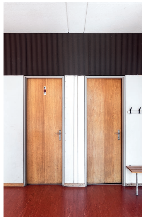
Oliver Marc Hännli

De même, les enfants qui ont fréquenté l'école de Wallrüti pourraient raconter beaucoup d'histoires sur le système Variel qui est l'expression d'une époque où la génération des grands-parents et des arrière-grands-parents des élèves actuels ont lancé de nouveaux procédés de construction qui ont marqué durablement la société et notre environnement construit.