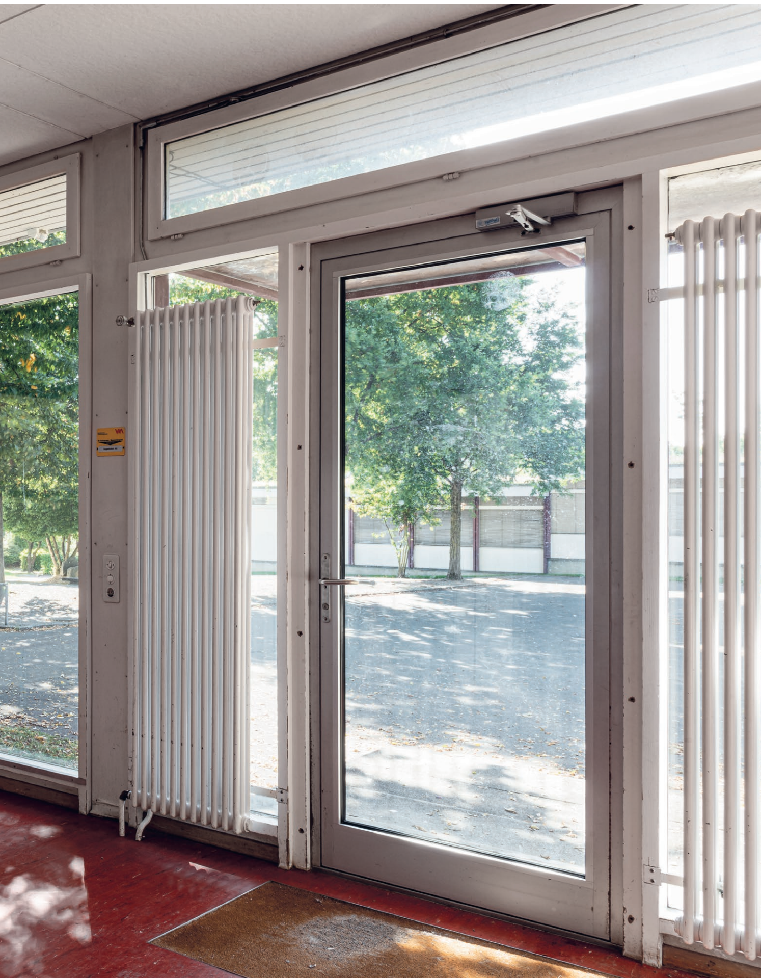
Le pavillon scolaire Variel de Winterthour-Wallrüti: par de grandes baies vitrées, on peut voir la cour d'école encerclée de bâtiments Variel. Une bande foncée et nervurée confère au hall d'entrée un horizon plus élevé. Elle est en harmonie avec les portes en bois et le linoléum rouge marbré.