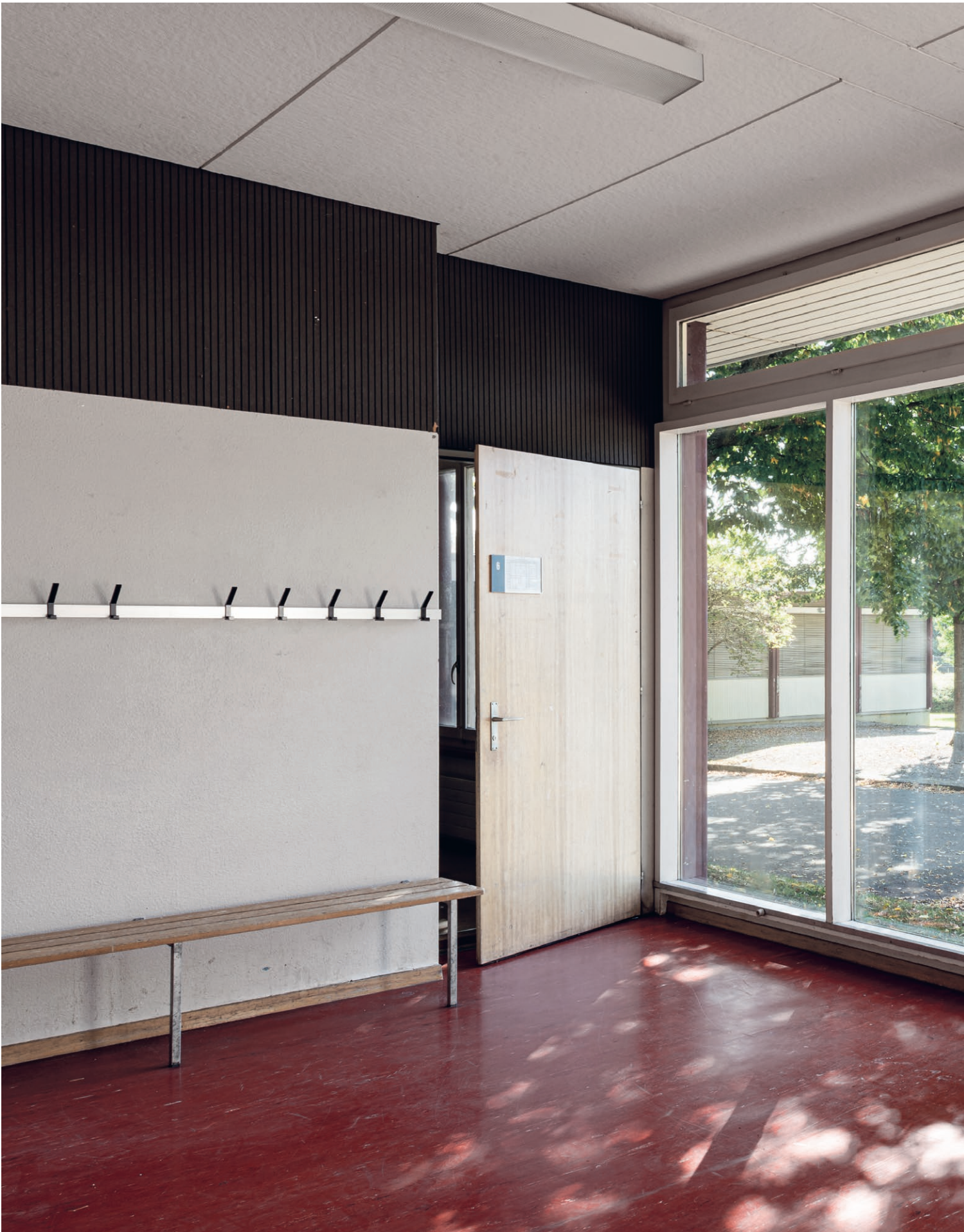
Variel-Schulpavillon in Winterthur-Wallrüti: Durch eine grosse Glasfront blickt man auf den Schulhof, der von den Variel-Bauten eingefasst wird. Ein dunkles, geripptes Band gibt dem Eingangsraum einen oberen Horizont. Es harmoniert mit den holzsichtigen Türen und dem rot marmorierten Linoleum.